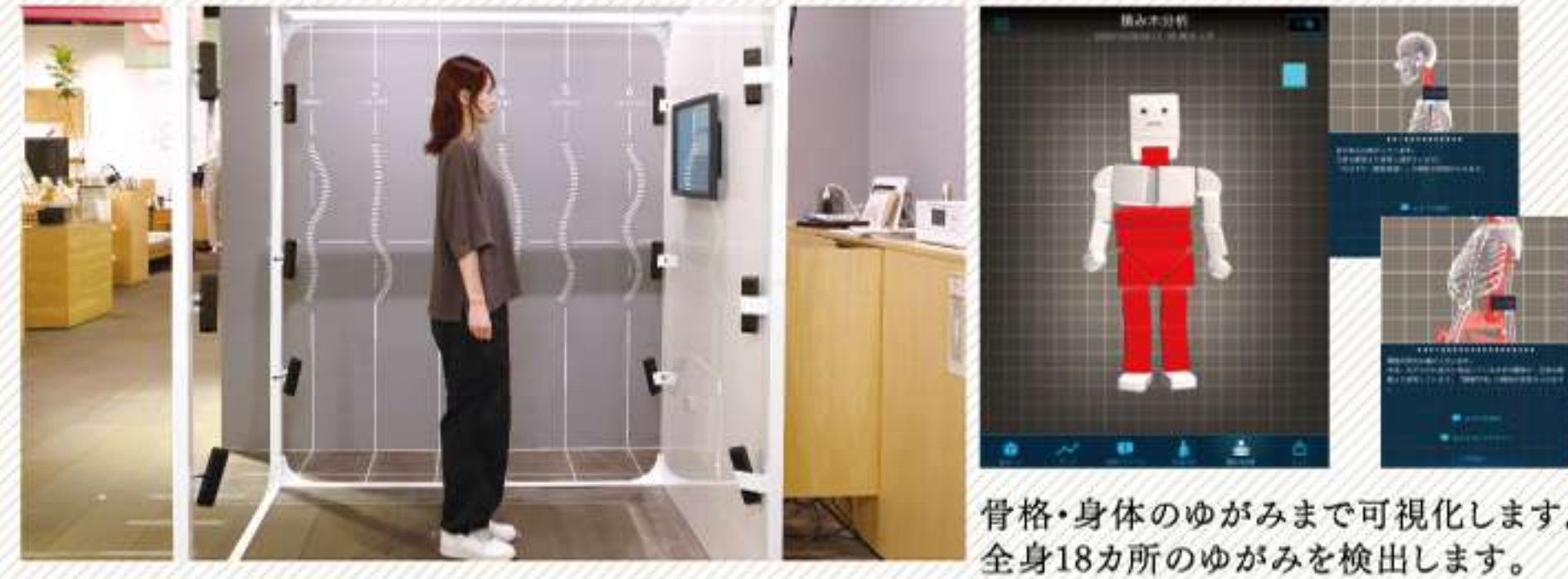
骨格・身体ゆがみまで可視化します。全身18カ所のゆがみを検出します。

全身の形状をミリ単位で3D計測が可能なボディスキャナーを使った測定機器です。お客様の骨格やゆがみを可視化し寝具選びをお手伝いします。