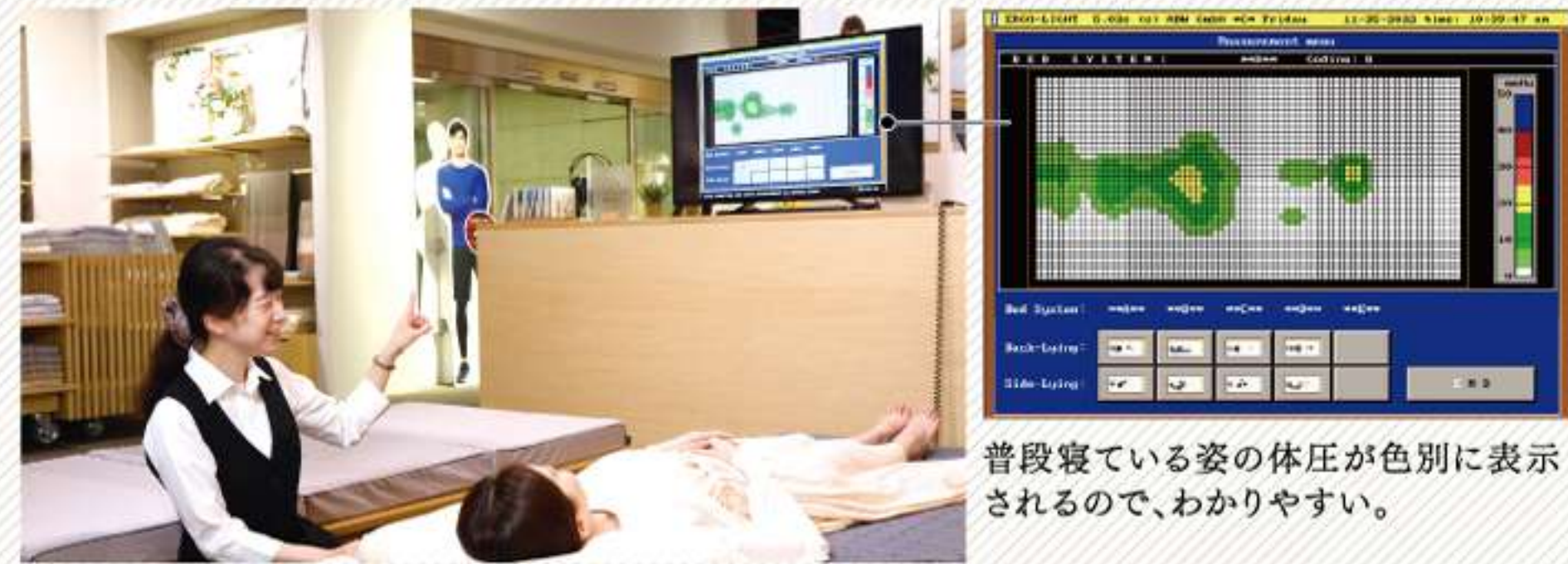
普段寝ている姿の体圧が色別に表示されるので、わかりやすい。

ベッドに横になった状態で身体にかかる圧力バランスを計測。マットレスを寝比べていただきながら負担の少ないマットレスをご提案いたします。